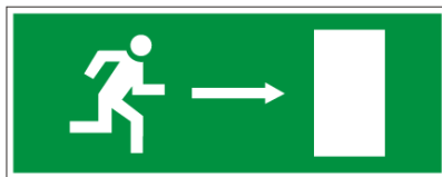
2.attēls “Evakuācijas izejas zīme”

Ja, trauksmes sirēnai skanot, izglītojamais telpā atrodas viens un neatrod nevienu pieaugušo, ir jāpamet Skolas telpas pašam – dodoties uz sev zināmo tuvāko izeju. Visas evakuācijas izejas aprīkotas ar zaļu uzlīmi “Evakuācijas izeja” (skatīt 2.attēlu).