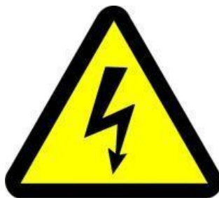
3.attēls “Elektrības brīdinājuma zīme”

3. Izglītojamais drīkst lietot Skolas kopētājus, datorus un citas elektriskās ierīces tikai ar Skolas personāla atļauju un pedagoga pavadībā.